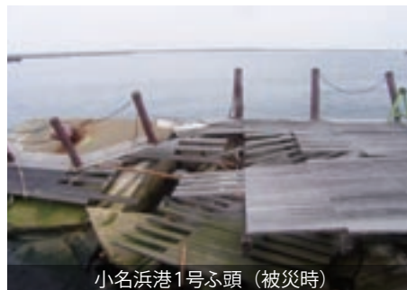
小名浜港1号ふ頭 (被災時)