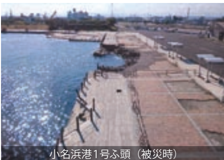
小名浜港1号ふ頭 (被災時)