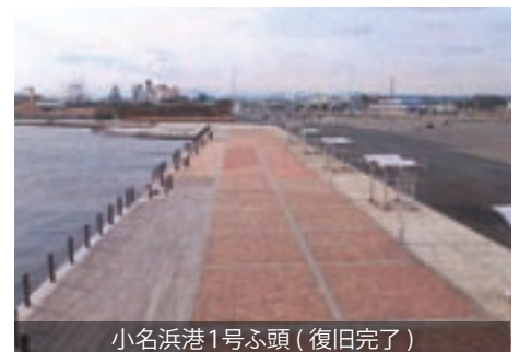
小名浜港1号ふ頭 (復旧完了)